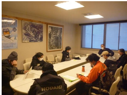
安全教育講習風景（技能向上）

また、シーズン営業中にも定期的に実務研修等を実施し、安全輸送に対する意識の保持に努めています。さらに、索道従事者を専門機関主催の各種研修会等へ参加させています。